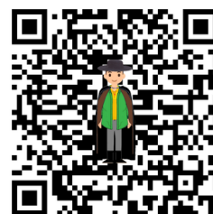
Jeu des associations

Chaque image représente un métier ou un objet relié à un métier. Gardez les cartes représentant les objets dans vos mains. Disposez les cartes représentant les métiers au centre du cercle et montrez une carte-objet à la fois. À tour de rôle, les enfants doivent déterminer à quel métier cet objet est relié.